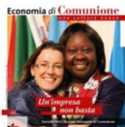
Notiziario Edc n.41