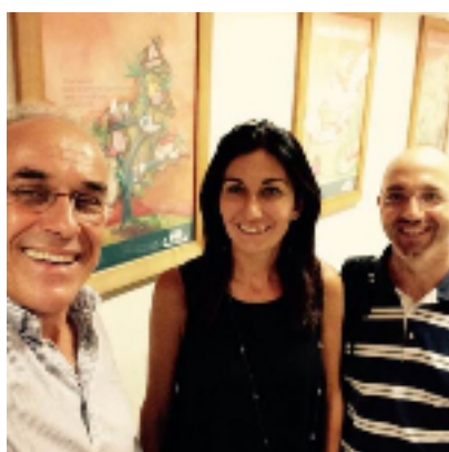
Incontro Aipec - Unioncamere 6/08/2015