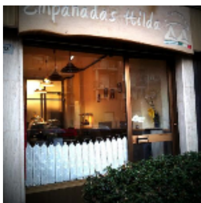
GRAZIE da Empanadas Hilda

“Prometto di spendere la mia vita come apostolo di un’Economia di Comunione e così contribuire a un mondo più giusto e fraterno”. Questo il testo del patto firmato dai presenti al termine del 5° Congresso Internazionale EdC alla Mariapoli Piero (Nairobi, Kenya). Un’emozione inaspettata mi ha avvolta quando Luigino Bruni ha letto il testo prima in inglese, poi in italiano: circondata da tutto il mondo, sentivo che la decisione di firmare muoveva le corde più profonde del mio essere.... CONTINUA