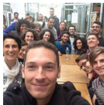
Adotta un Giovane Workshop School EdC “ #GeneriAmo #Idee ”